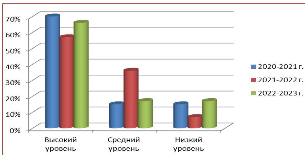
Рис. 1. Уровень адаптации детей к новым образовательным условиям

Результаты сопровождения воспитанников в период адаптации к детскому саду свидетельствуют, что в ДОУ созданы условия для успешной адаптации и развития в новых образовательных условиях вновь прибывших или переведенных из других групп детей (рис. 1).